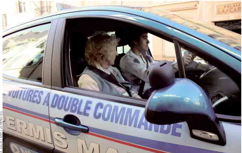
Le passager a lui aussi accès aux pédales d'accélérateur, de frein, d'embrayage ou aux clignotants.